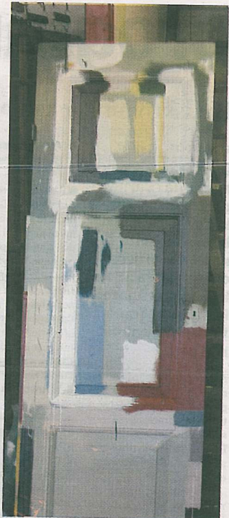
Färgpalett. Olika kulörer har provmålats på en gammal dörr.